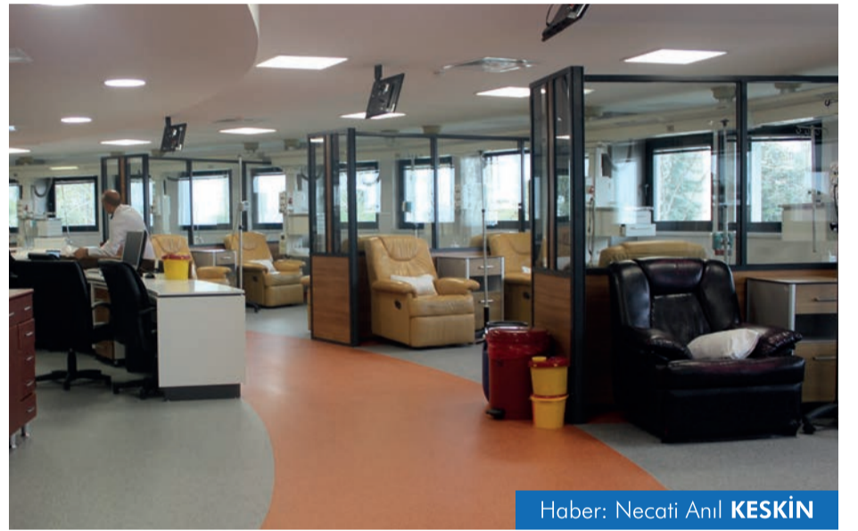
Haber: Necati Anıl KESKİN